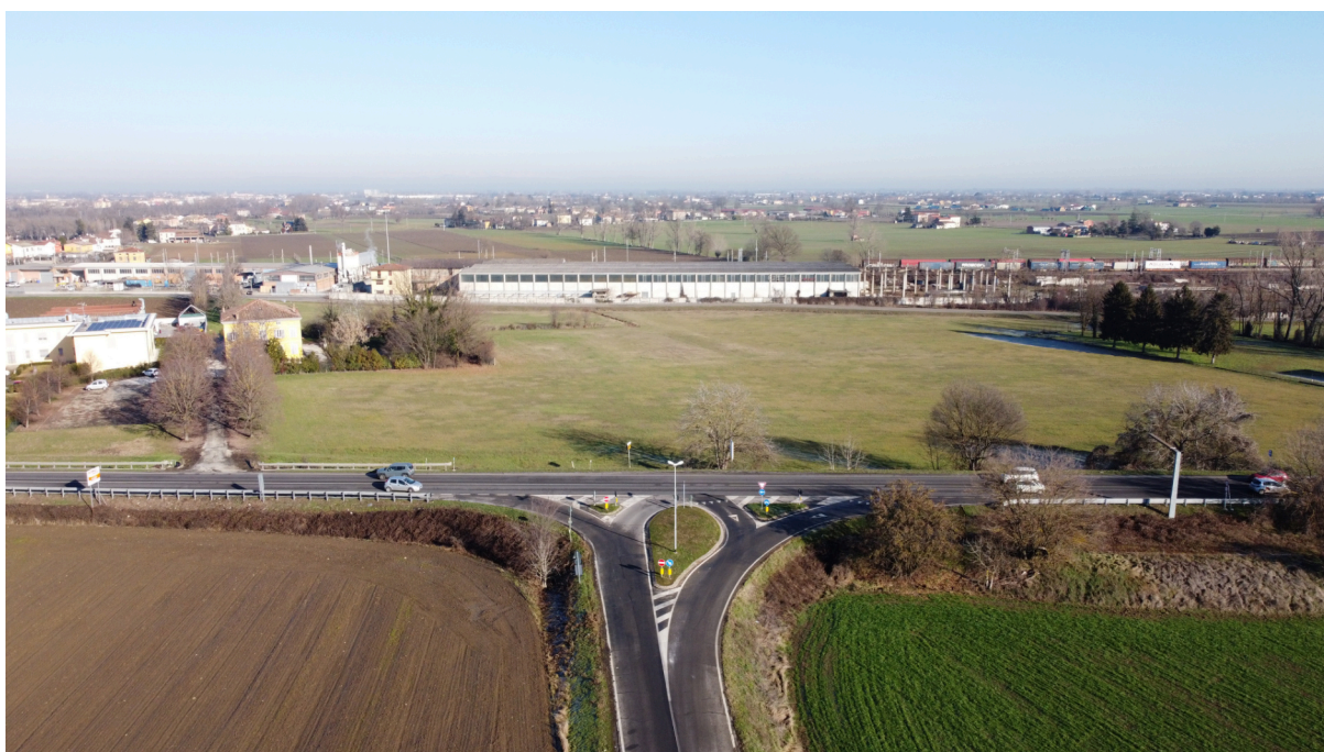
Foto aerea da sud