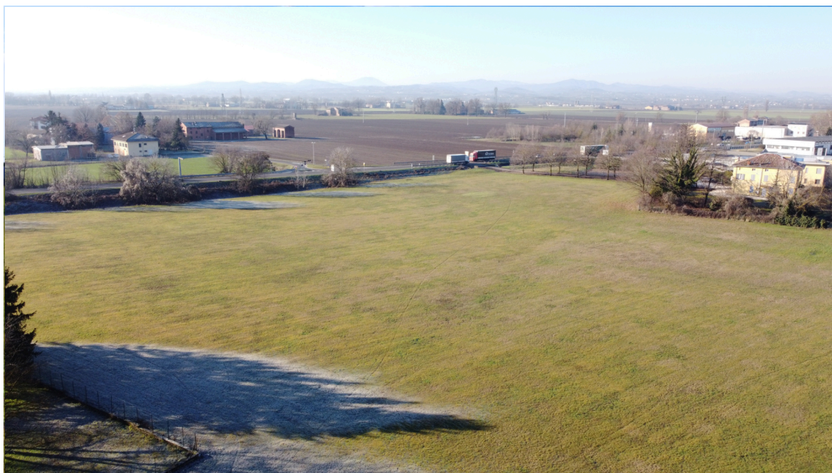
Foto aerea da nord/est