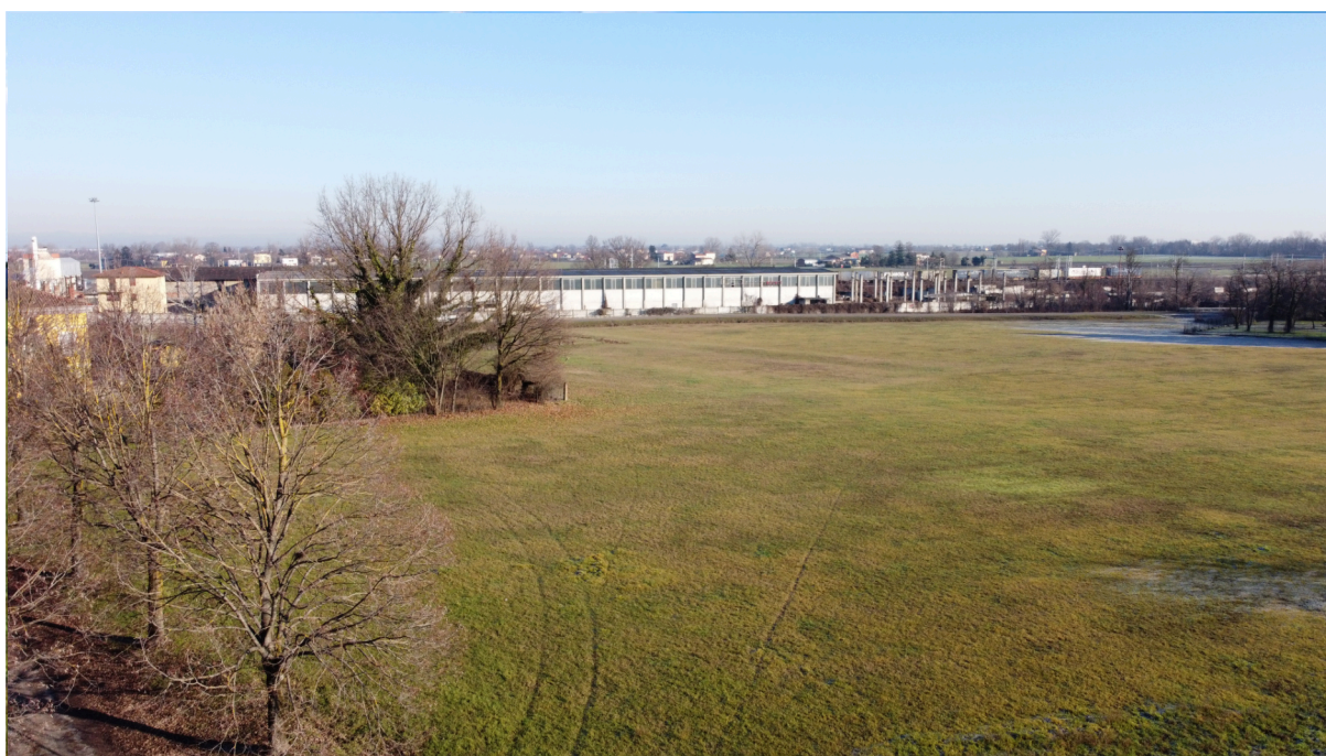
Foto aerea da sud/ovest